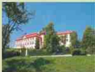
Okružní lázeňská chůze / Lázeňská chůze