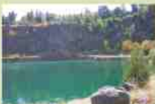
Okružní lázeňská chůze / Lázeňská chůze

Chůze je ideální pro lidi, kteří mají zdravotní problémy a potřebují si odpočinout a zotavit se. Chůze je také ideální pro lidi, kteří mají zdravotní problémy a potřebují si odpočinout a zotavit se. Chůze je také ideální pro lidi, kteří mají zdravotní problémy a potřebují si odpočinout a zotavit se.